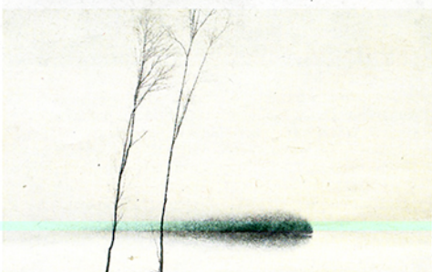
Praca Rafała Borczy zatytułowana „Dwie olchy”